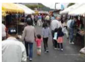
10/27 やわた産業まつり