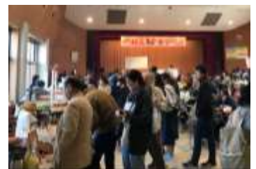
11/4 城下町松山秋まつり