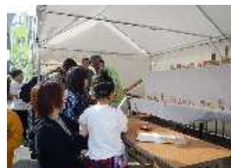
11/3 ひらた産業まつり