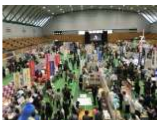
10/26・27 さかた産業フェア

各地域にて産業まつりが開催されました。当日は当会員事業所や青年部・女性部などが売店を出店し、自慢の商品をこの日限りの大特価で販売しました。模擬上棟式や餅つき大会、抽選会等も行われ、楽しいイベント盛りだくさんの産業まつりとなりました。