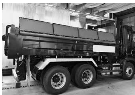
車両の色に合わせてカスタマイズできるシート