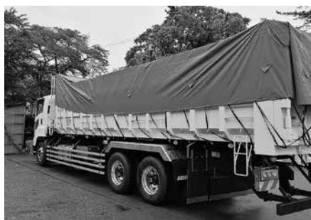
オーダーメイドによる車両と一体化したシート