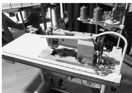
持続化補助金にて導入した2本針ミシン