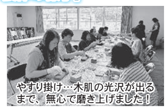
やすり掛け…木肌の光沢が出るまで、無心で磨き上げました！