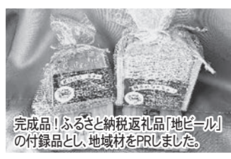
完成品！ふるさと納税返礼品「地ビール」の付録品とし、地域材をPRしました。