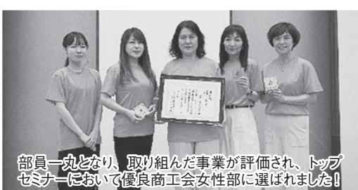
部員一丸となり、取り組んだ事業が評価され、トップセミナーにおいて優良商工会女性部に選ばれました！

女性部員大募集!! ✓ 地域の魅力を発信したい方 ✓ モノづくりや体験活動に興味がある方 ✓ 新しい仲間との交流を楽しみたい方 あなたも商工会女性部員の一員として、一緒に地域を盛り上げませんか？お問い合わせは所属商工会まで