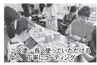
ニス塗り…長く使っていただけるよう、丁寧にコーティング