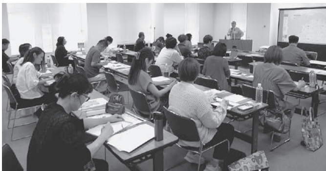
創業塾2025 受講の様子

令和7年8月23日、24日、30日、31日および9月6日の5日間、創業予定の方や創業間もない方約50名の参加のもと「創業塾2025」を開催しました。本年度は、オンラインとリアルを組み合わせたハイブリッド形式で実施し、創業特化型生成AI「Ai助」を受講者全員に3ヶ月間無償提供しました。これにより、受講者は創業計画の策定やビジネスモデルの検証に積極的に活用し、より実践的なビジネスプラン作成が可能となりました。受講者アンケートでは満足度が95.9%に達し、「AI活用で創業計画作成が格段に進んだ」などの喜びの声が多数聞かれました。今後も新たな技術を取り入れながら、皆さまの夢の実現を支援してまいります。